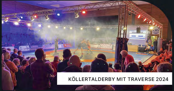
KÖLLERTALDERBY MIT TRAVERSE 2024