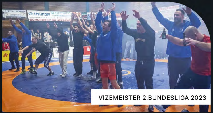
VIZEMEISTER 2. BUNDESLIGA 2023