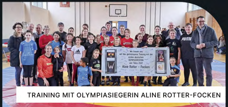
TRAINING MIT OLYMPIASIEGERIN ALINE ROTTER-FOCKEN