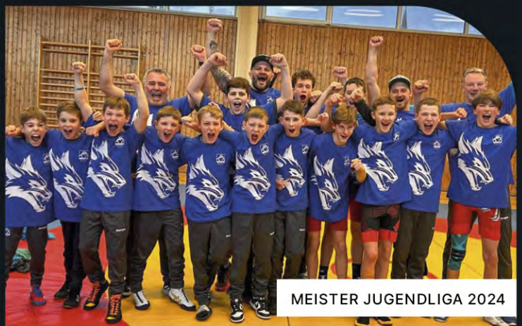
MEISTER JUGENDLIGA 2024