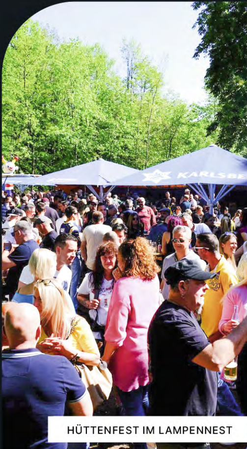
HÜTTENFEST IM LAMPENNEST